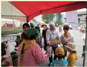
▲ルバーブ・ほうすき・ひまわり油・ジュース・チーズ ほか