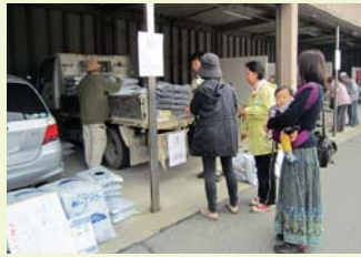
▲生ゴミ食いしん坊・ポカシ・完熟堆肥 ほか