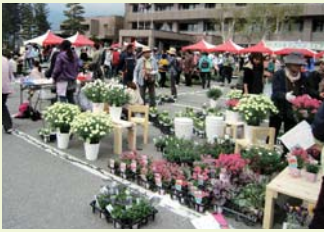
▲花・野菜・苗 ほか