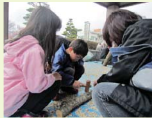
▲しいたけの駒打ち(持ち物:かなづち・軍手)