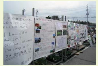
▲エコな豆知識・苗の育て方 ほか