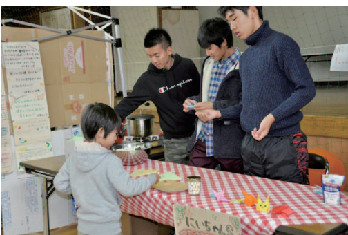
▲高校生が定員さん「ポップコーンブース」