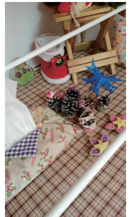
▲ティッシュカバーと木の実のキャンドル

11月19日(土)、第8回目のとととと広場を開催しました。子どもや子育て家庭を中心とした地域交流が目的のイベントです。今年も子どもの店、大人の店が30ブースほど集まり、乳幼児から小中高生、大人が互いに交流しながら楽しく過ごしました。出店した小学生の中には、売上金を友達との学校生活の思い出作りに使うという子もいて、買ってもらうために一生懸命商品をアピールしていました。前述のティッシュカバーや木の実のキャンドルはこのお店で購入しました。思い出作りに協力したいなという気持ちもありましたが、小学生がひとつひとつ思いを込めて作ったものが、生まれてまだ間もない乳幼児が過ごす子育て広場で役に立っている、というのが素敵だなと考えたからです。とととと広場という名称には手と手をつないで地域をつくっていきこう、という思いが込められています。そこに集まった子どもも大人もそれぞれが地域に役立つものを提供し、それで得た収入で自分たちの暮らしを心豊かにする、地域や社会は一人ひとりがつながり輪になっていて、支えあって作られているということを伝えられると嬉しいです。