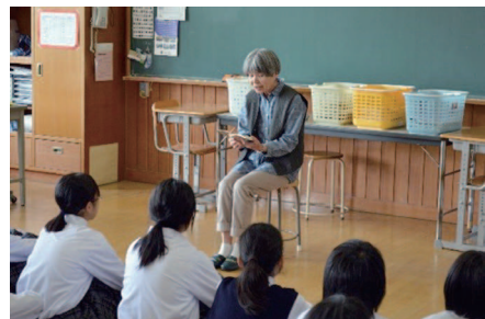
▲ボランティアの方による読み語り