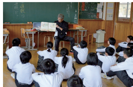
▲ボランティアの人数が不足する場合には職員が読み語りをします。