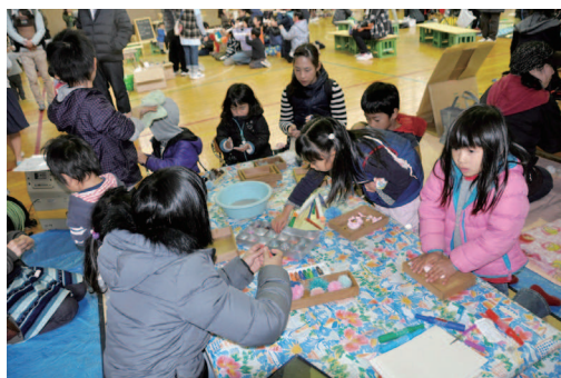
▲中学生が定員さん「おねんどさんブース」