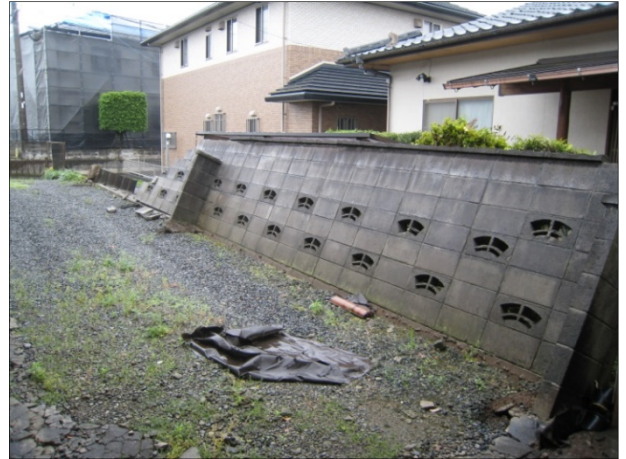
現行基準に適合せず転倒したブロック塀