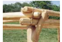
▲「木組み」をしたら藤蔓で固定