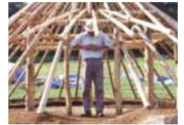
▲住む人に合わせた住居です

復元にあたっては、柱の間隔や梁の高さなど、住居の大きさが「人体尺=体の各部の長さを基準にしている」で設計されています。そして、釘などは一切使っていません。安全のため一箇所だけは針金を使っていますが、それ以外は縄文時代と同じ材料とやり方です。建てられてからもう28年。まだまだしっかりしていますね。