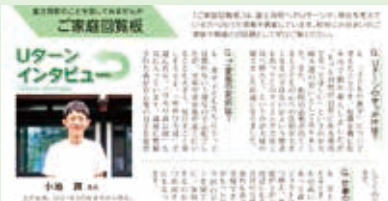
▲広報ふじみ 令和3年8月号

「帰ってきたくなる町」を目指し、広報紙等を通じて転出者に向けたUターン情報等をお知らせします。