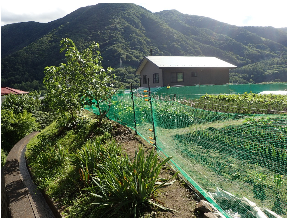
立木と柵が近接していると飛び越えられる

なお、当然ですが、果樹（特に果実が成っているのを放置している状態）が侵入防止柵の周囲にあれば、それが少し離れているとしても、ニホンザルを畑におびき寄せる要因になります。せっかく侵入防止柵を設置しても、一方で柵近辺にニホンザルをおびき寄せているようでは、少しのほころびがあればすぐ被害が発生してしまうリスクになります。こうしたことは、果樹のみならず、侵入防止柵を設置していない畑や果樹園、あるいは庭先のカキノキなど、いずれも同じことです。ニホンザルが近づいてくる環境であれば、侵入防止柵を設置する、あるいは畑地や果樹等を放置しないということが重要です。