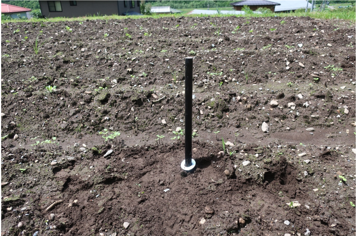
短いパイプにワッシャを入れ、長い支柱を支える構造にする。