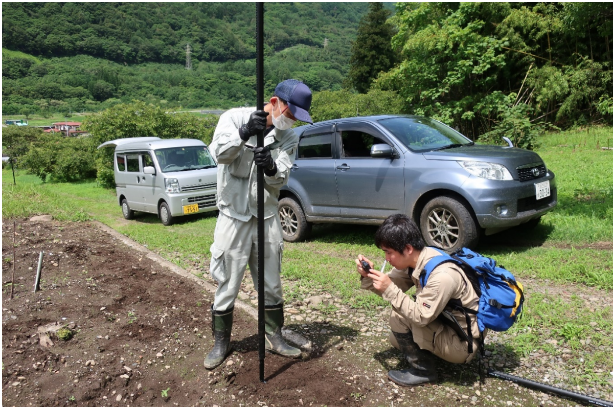
短いパイプに支柱を差し込むと支柱設置が完了する。圃場の角に位置する支柱はやや外側に傾けて立てる（ネット等を張ると内側に引っ張られるため）。