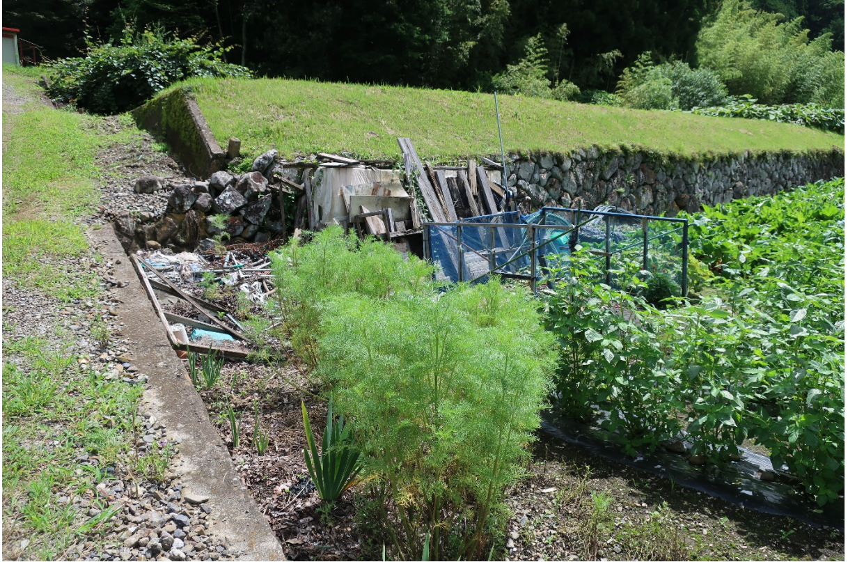
上段と下段の圃場の間に段差あり