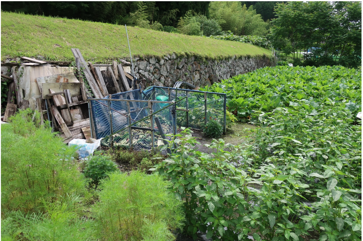
生ごみ捨て場あり