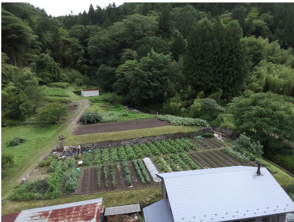
モデル圃場の全景

なお、モデル圃場には、ルバーブ、ナス、キュウリ、モロヘイヤ、トウモロコシなどが植えられています。