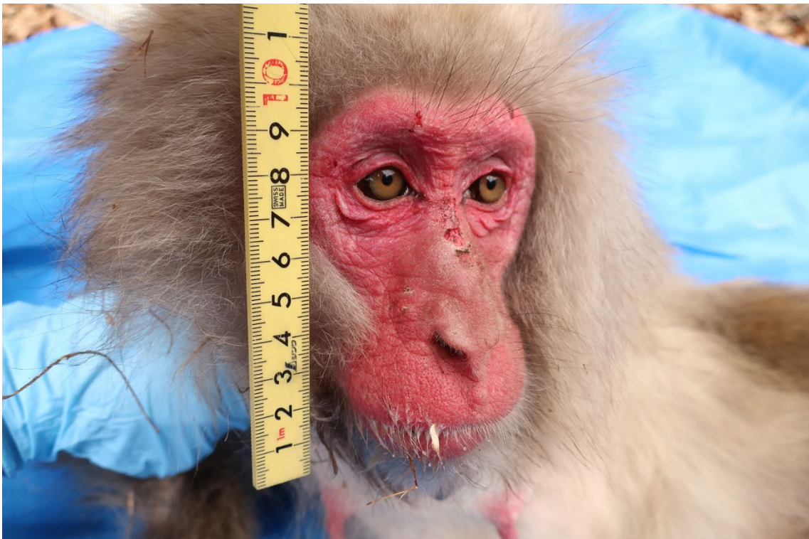
サル（成獣）の顔の長さはおおよそ 10 cm

特にニホンザルに効果を発揮する柵線の高さは、サルがしゃがんだ時に顔のどこかが柵線に触れる地上高 10 cm程度（サルの子供の侵入を防ぐには 5 cm）が推奨されます。長野県獣害防止用電気柵導入基準では、柵線の再下段の高さは 15 cm以下、とされており、これはイノシシの侵入防止が想定されています。サルの場合は、10 cmに極力近づけることが望ましいでしょう。