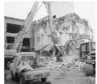
ホテルニューふじみ建物解体工事