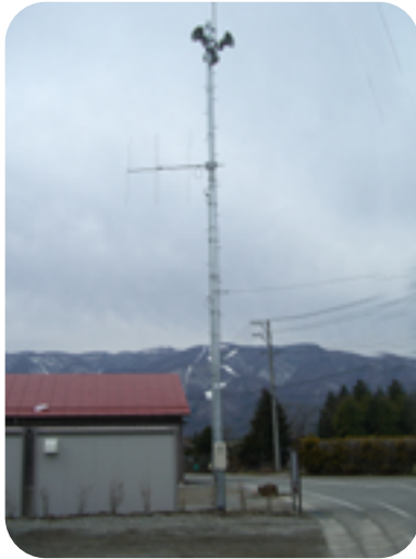
防災行政無線整備費(消防費) 5,241万円