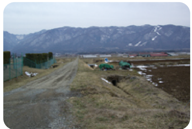
中山間地等直接支払事業(農林水産業費) 1億524万円