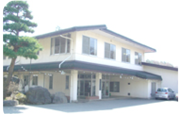
清泉荘耐震診断・管理費(民生費) 2,204万円