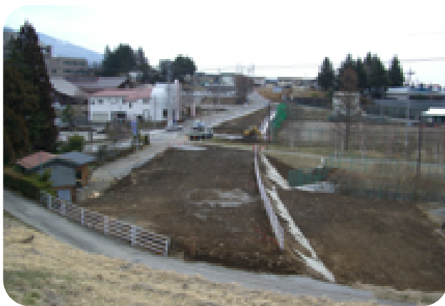
北通り線整備事業(土木費) 1億40万円