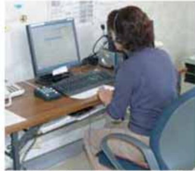
予約センター(オペレーター室)

ただだけの方がいることです。店の店内を回ってお客さんを探す事もあるそうです。これから冬を迎え路面の凍結などで危険が増えますが安全運転で送迎したいとやさしく話して頂きました。