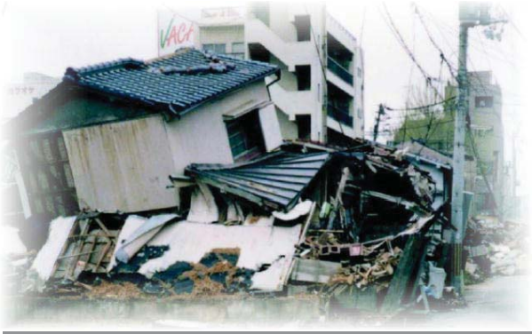
平成7年（1995）1月17日の阪神・淡路大震災では、10万棟を超える家屋が全壊し、6,400人を超える尊い命が犠牲になりました。犠牲者の大部分は家屋の倒壊等による圧死でした。

富士見町耐震改修促進計画は、町内の既存建築物の耐震性を確保するため、耐震診断と耐震改修（補強工事等）を促進することにより、耐震性能の向上と今後予想される地震災害に対し、町民の生命・財産を守ることを目的とし実施しています。