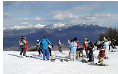
スキーズーン (スキー客で賑わう)