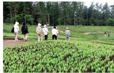
グリーンシーズン (すずらん公園)