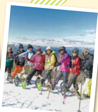
スノーシュートレッキング