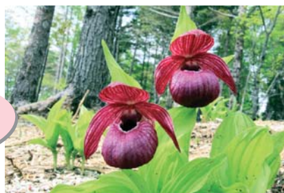
【野に咲く釜無ホテアツモリソウ】