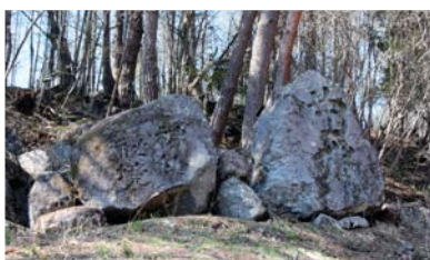
【盃流し】 約100mに及ぶ1枚岩に清流が 流れ込み、長い年月をかけ自然が 造りだした景観