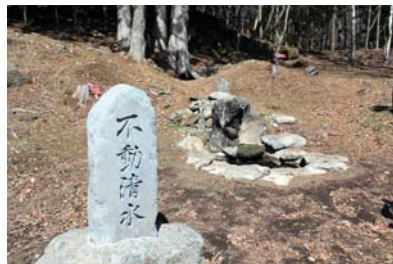
【不動清水】 登山者等の憩いの休憩場所