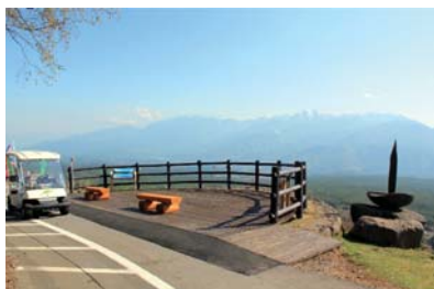
【創造の森 望郷の丘】 標高1,420mの天空公園

「観光圏の整備による観光旅客の来訪および滞在に関する法律」(観光圏整備事業計画)に基づくブランド観光圏として、地域の関係者が連携し、地域の幅広い資源を活用しています。また、地域の魅力を高めることにより、国内外から観光客が滞在交流型観光を行うことができる観光圏の形成を促進し、平成25年度観光地域ブランド確立支援事業を実施しました。