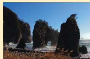
ふるさと部門グランプリ「奇岩」