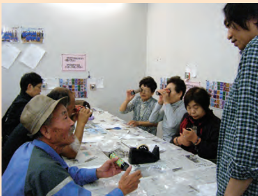
▲万華鏡の出来上がりを確認中

1日目は黄金崎クリスタルパークで万華鏡作りの体験や黄金崎の見学をしました。ご自分で制作された万華鏡を「孫のお土産に」と丁寧につまみ作られていました。ホテルでは少しずつ海に傾いてゆく夕陽を鑑賞。また2日目は堂ヶ島の加山雄三ミュージアムを見学や、洞窟めぐりの遊覧船で西伊豆の海、隣町の松崎町にある重要文化財岩科学校などを楽しんでいただきました。