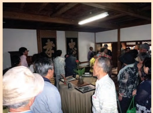
▲岩科学校では、古い養蚕道具に懐かしい様子でした

今回参加された方の中には、「前回も参加したよ」「今年の夏も宿泊したよ」という方も。来年は西伊豆町から富士見町を訪問する予定です。今後も姉妹町の絆を深めていきましょう。