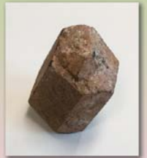
角閃石 (歴史民俗資料館蔵)