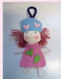
▲フェルト人形作り