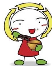
ながのけんりサイクルキャラクター「クルルん」

そろそろお開き（万歳、締め）となりますが、その前に皆様、もう一度初めの席にお戻りください。テーブルの上にはまだまだお料理が残っております。有るを尽くして、気持ちよくお開きにしましょう。