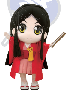
当日は諏訪姫もやってくる!

この他にも、ステージ発表やスライド上映など、楽しい企画を多数用意してお待ちしています。皆様お誘いあわせてお越してください。