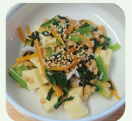
(富士見町地域活動栄養士)