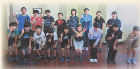
「境小6年生集合写真」