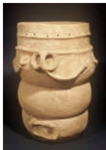
▲三日月型の腕の蛙

井戸尻文化の土器の中に、蛙の造形を見ることができます。キョロロとした二つ目と、三本指の手足、ときおり丸い胴体で表される姿は、ちょっとユーモラスで愛らしいですね。でも、なぜ蛙を土器に表したのでしょうか。