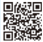
予約フォーム QRコード