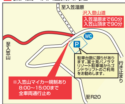
C 拡大図 入笠山周辺