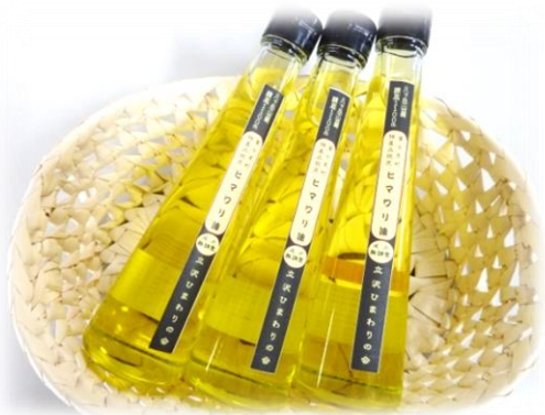
ひまわり畑とひまわり油