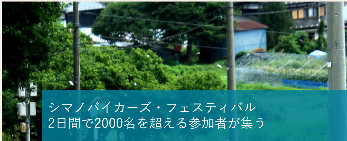
シマノバイカーズ・フェスティバル 2日間で2000名を超える参加者が集う