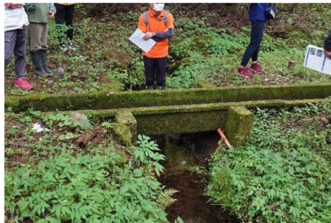
田園風景を支えるセギの歴史を知る