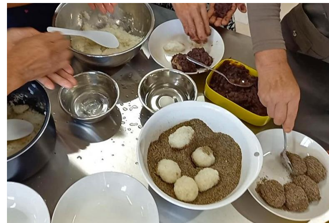
富士見の郷土料理を体験する