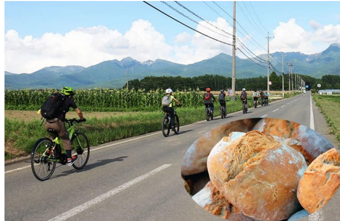
富士見町のパン屋さんをEバイクでめぐる