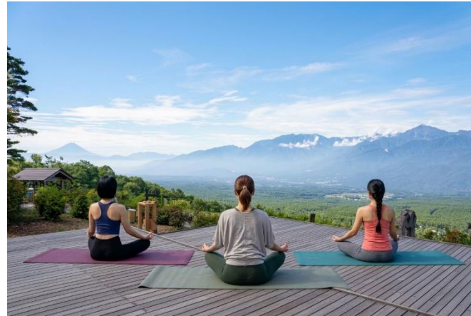
絶景スポットで朝ヨガ & 朝食体験