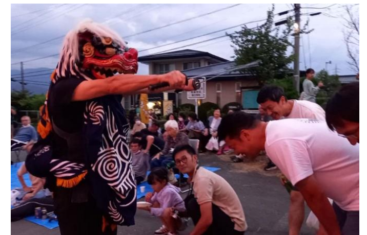
地区の文化を体験する