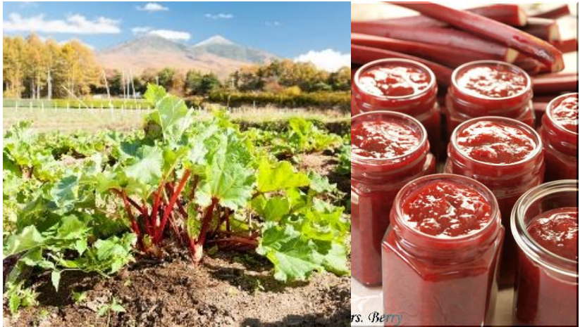
赤いルバーブとジャム