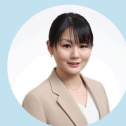
長野県宅地建物取引業協会 富士見分会