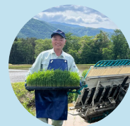
行政書士/元役場職員