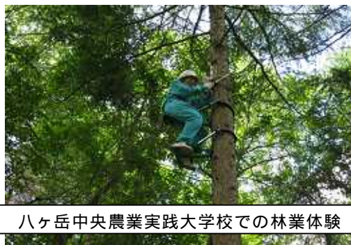
八ヶ岳中央農業実践大学校での林業体験