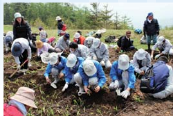
すずらん公園の整備

・夏季シーズンの入笠すずらん公園の整備や、冬季のスキー営業日の早、長期化により増客につながりました。