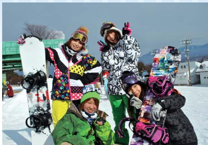
若者でにぎわうスキー場